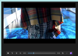
①洋服紹介+コーディネート