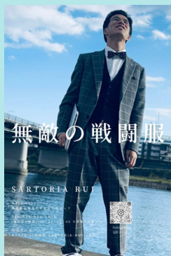
「無敵の戦闘服」をキャッチ コピーとしたポスター

SARTORIA RUI (サルトリアルイ) ☎055-952-6126 沼津市大手町5-2-7