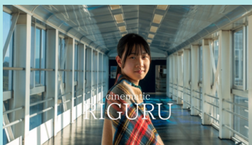
動画の内容を関連させるポスター