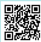
動画制作 店舗Instagramより視聴可能