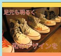
②小物など雑貨紹介

商品の紹介は、ネットショッピングで購入してもらえるよう春夏秋冬に合わせたコーディネートをわかりやすく紹介した。